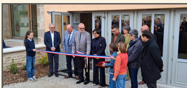
Inauguration le 15 mai 2026, en présence de Michel Fournier, ministre délégué chargé de la Ruralité