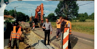
Lors du chantier avec les entreprises Cardinal et Dupont

A Charmes , une nouvelle portion du sentier de promenade du Lac de Charmes (en rive nord du bassin central du lac) a été inaugurée le 12 juillet.