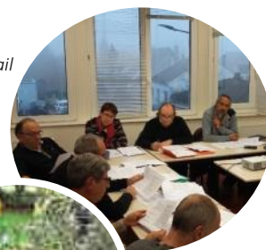
Les membres du CDT au travail

Une quinzaine de membres du CDT travaille activement sur les propositions qui seront présentées fin janvier aux élus avant envoi à la Région Grand Est.