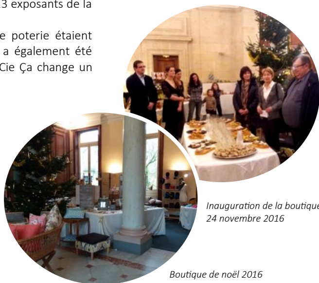
Inauguration de la boutique le 24 novembre 2016

Contact au PETR : Laure PARMENTIER, Animatrice Communication-Culture / parmentier@pays-langres.fr / 03.25.84.10.02