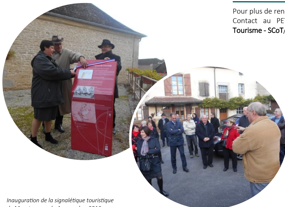
Inauguration de la signalétique touristique de Montsaugeon le 4 novembre 2016

Contact au PETR : Emmanuel PROBERT, Chargé de mission Tourisme - SCoT/ probert@pays-langres.fr / 03.25.84.10.04